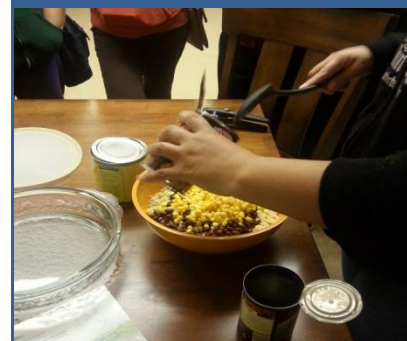
Participante de Lindsay FRC preparando un platillo de Enchiladas en Cacerola.

Classes empiezan el 27 de Junio en la Margaret J Slattery Library, localizada dentro del Heritage Center, 256 E. Orange Ave Porterville a las 9:00am-10:00am cada Martes y terminan el 25 de Julio.