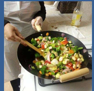
Lindsay FRC Class participant preparing a Tofu Stir-fry